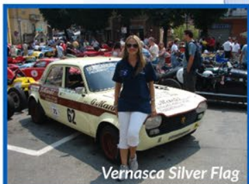
Vernasca Silver Flag