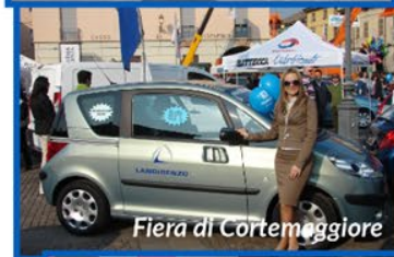
Fiera di Cortemaggiore