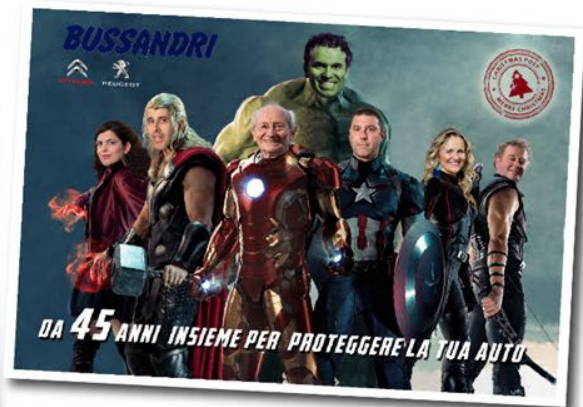
BUSSANDRI - Da 45 anni insieme per proteggere la tua auto

Un evento che si ripete ogni anno ma ogni volta è unico.