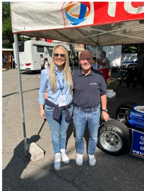
Miki Biason - Pilota Rally italiano due volte campione del mondo.

Per 30 anni sono stata Responsabile Pubbliche Relazioni e di organizzazione di eventi avendo la possibilità di conoscere diversi volti noti del settore automotive.