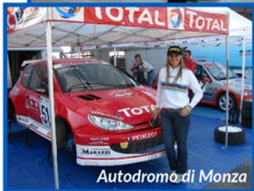
Autodromo di Monza