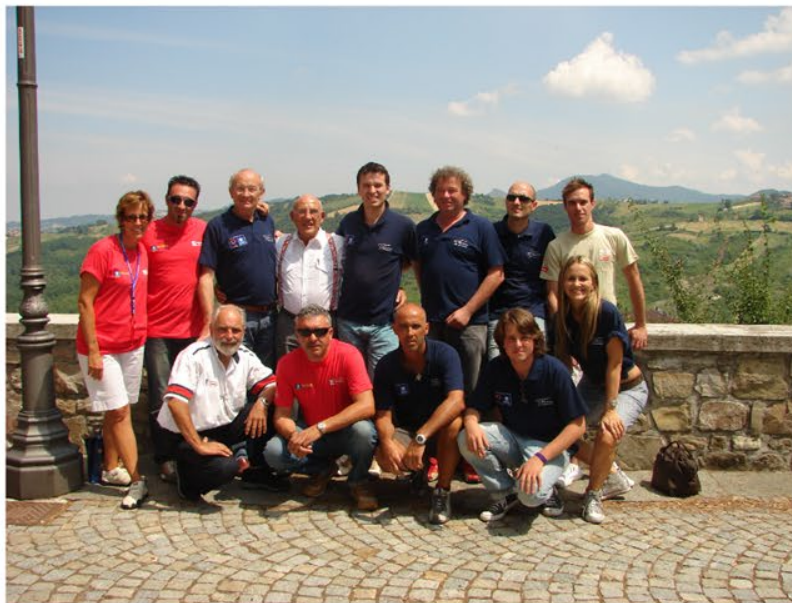
Stirling Moss - Pilota britannico Formula 1

Per 30 anni sono stata Responsabile Pubbliche Relazioni e di organizzazione di eventi avendo la possibilità di conoscere diversi volti noti del settore automotive.