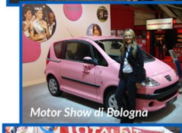
Motor Show di Bologna