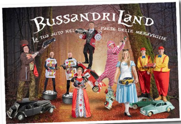
BUSSANDRILAND - La tua auto nel paese delle meraviglie