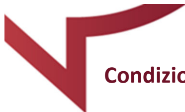
TABELLA DELLE PRESTAZIONI E DEI MASSIMALI

L'Assicuratore, a seconda della forma di copertura assicurativa attivata dal Contraente e richiamata sul certificato di polizza, terrà a proprio carico i costi delle Prestazioni erogate alle condizioni e con i limiti indicati nella sezione "Cosa è assicurato", entro il Massimale indicato nella seguente tabella: