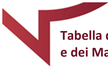
Tabella delle Prestazioni e dei Massimali