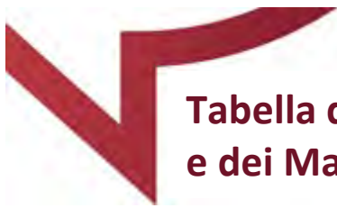
Tabella delle Prestazioni e dei Massimali